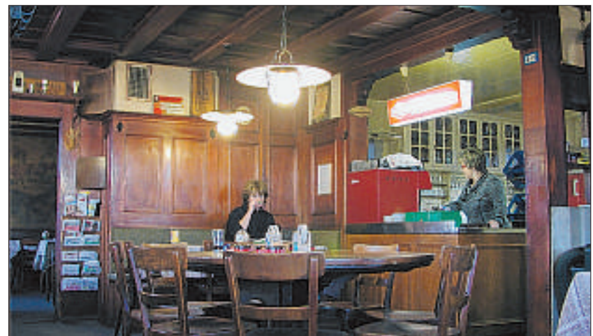
BALD GESCHICHTE Ein letzter Blick in die «Wirtshüsli»-Gaststube. PK

Entschieden ist dafür das Schicksal des Wirtschaftsbetriebes im «Wirtshüsli»: Am Freitag, 22. Dezember ist «ultimo». Das Restaurant wird danach geschlossen, und am Samstag, 13. Januar findet ein Inventarverkauf statt. Zum Teil werden die Objekte gar gratis abgegeben. Es dürfte die letzte Gelegenheit sein, sich ein Erinnerungstück der altherwürdigen Quartierbeiz zu ergattern, die in den letzten Jahrzehnten zwar ihr Cachet des 19. Jahrhunderts bewahrte, mangels Investitionen leider aber immer mehr zum Liquidationsobjekt verkam. (PK)